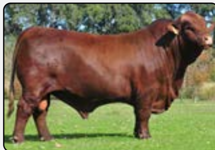
Abuelo materno: Pozo 4552 Home Run