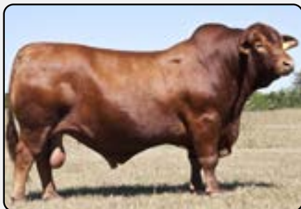
Abuelo paterno: Tres Cruces Cardenal 4312